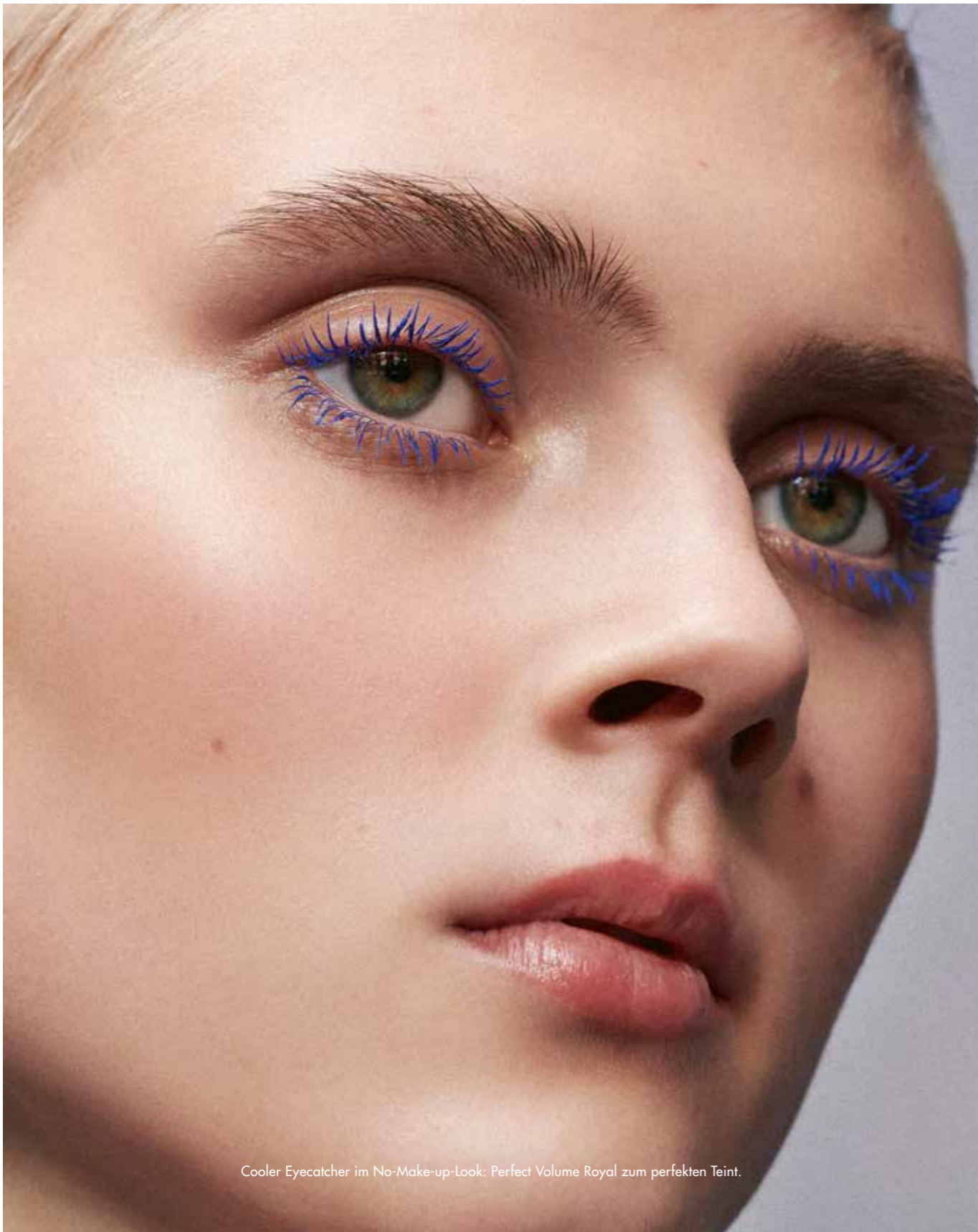
Cooler Eyecatcher im No-Make-up-Look: Perfect Volume Royal zum perfekten Teint.