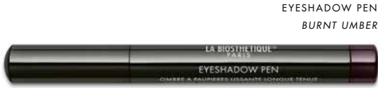
EYESHADOW PEN BURNT UMBER

NEUE FARBEN UND TEXTUREN FÜR FRISCHE, OPTIMISTISCHE AUSBLICKE.