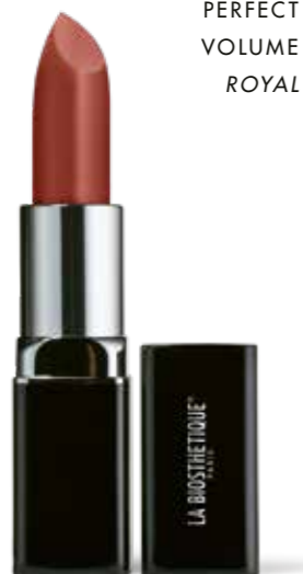
PERFECT VOLUME ROYAL